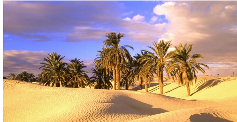
Sahara: overzicht en relevante details.